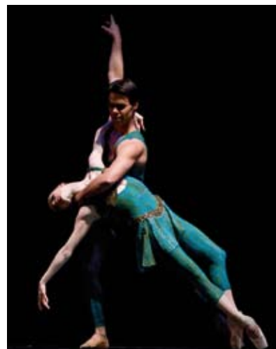
San Francisco Ballet - Within the Golden Hour . Foto: Erik Tomasson