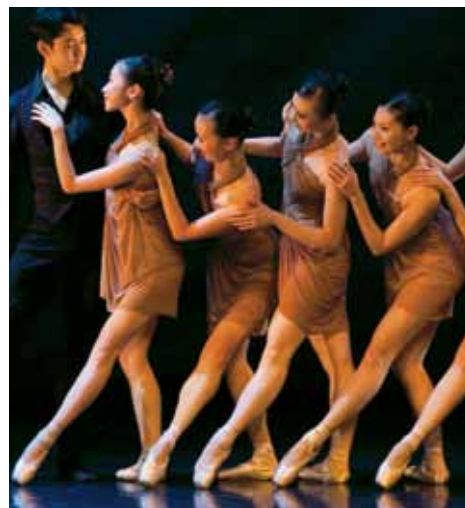
Singapore Dance Theatre.