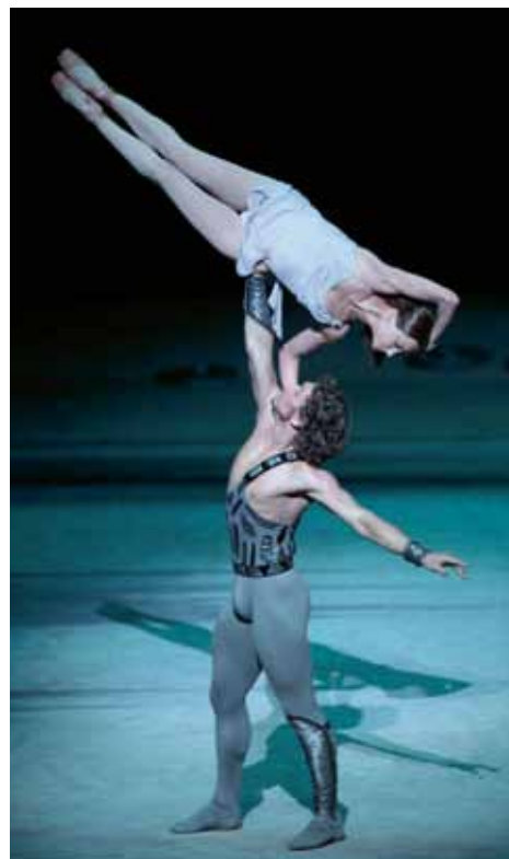
Bolshoi Ballet en Espartaco en Madrid.